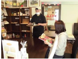
喫茶 YELL での接客