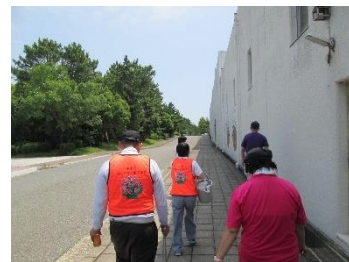
清掃作業（平磯公園）