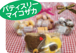
パティスリー マイゴザカ